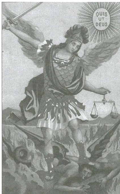
L-Arkanġlu San Mikiel kien dejjem imfittex bħala tarka ta' għajjnuna kontra kull tip ta' ħażen.

tagħha ta' kif tegħleb lix-xitan, it-tnejn li huma jinsabu fi stat liminali kważi taħt dwiefer ix-xitan waqt li x-xitan ikollu jzomm mal-kliem preċiż tal-patt u jistenna. Barra milli trid issalva ruħha, huwa dan il-kontroll fuq żewġha li l-mara trid,