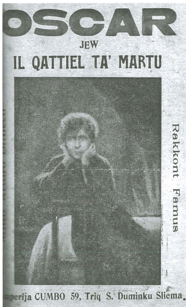
Aktar stejjer ta' qtil u waħx

Fil-folklor tagħna nsibu diversi stejjer oħra li fihom jirrakkontaw fid-dettall deħriet ta' erwieħ jew spirti tajbin u ħżiena. Sintendi l-ispirti t-tajbin huma dawk li ma jagħmlux ħsara lill-bniedem, u li aktarx jidhru għax f'ħajjithom kellhom xi missjoni x'jaqdu u ma laħqux wettquha, waqt li l-ispirti l-ħżiena huma dawk li jwerwru familji sħaħ u li kapaċi jagħmlu l-ħsara u jweggħu serjament lill-bniedem.