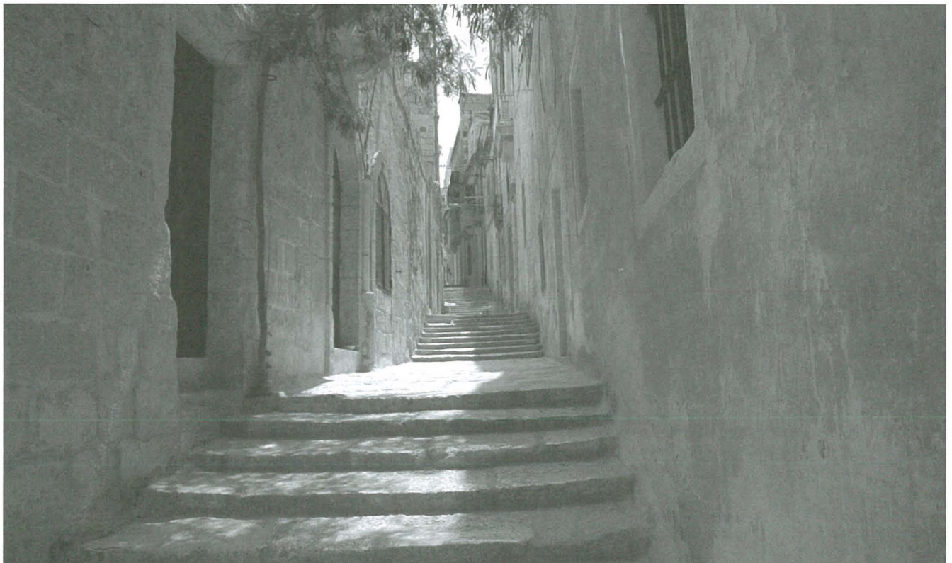
Waħda mit-toroq l-antiki f'Bormla, b'għajdut u stejjer tal-fatati

Jekk il-ħares jeżistix jew le, jien ma nafx, iżda ma nidhax b'min jemmen li jeżisti.