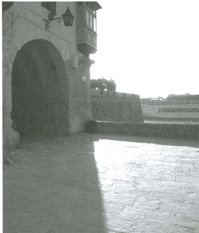
Iċ-ċint qrib il-mina li tagħti għall-ponta tal-Isla fejn jingħad li mara darba rat tliet furnara

Hawnhekk ir-raġel beda jwiddeb lit-tifel biex jinżel minn fuq il-ħoġor tat-tieqa. L-għajjat tar-raġel semgħetu l-koppja li minnufih xirfet minn waħda mit-