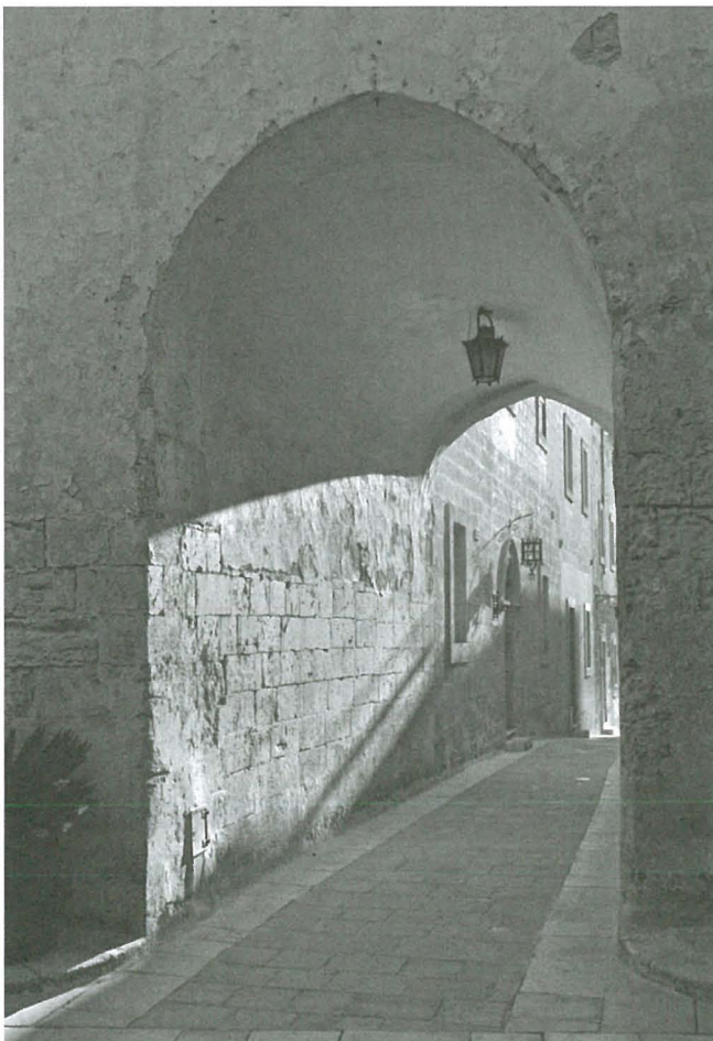
ħafna djar antiki fl-Imdina spiss jissemew fil-Folklor fuq il-ħares

Aktarx li l-aktar storja popolari fejn jidhlu dawn l-erwieħ jew spirti f'postijiet storiċi hi dik tal- Mara l-Bajda li jingħad li kienet tidher fil-Kastell ta' Sant'Anġlu, u li għal ħafna snin kienet magħrufa bħala l- White Lady . Fis-snin sebgħin, ħabib tiegħi li kien