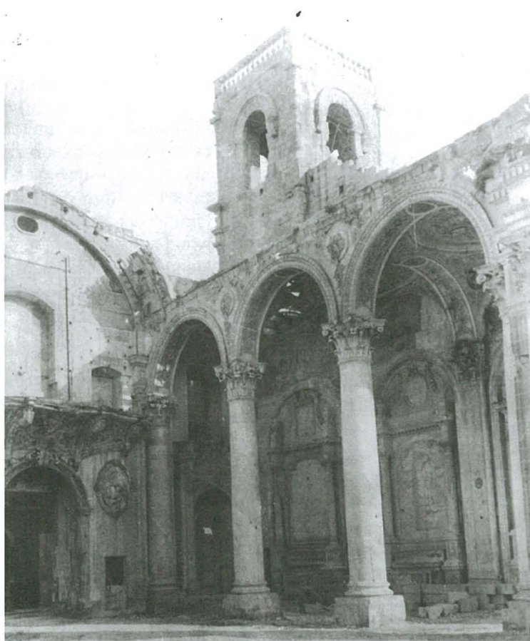
Il-knisja ta' San Diminku fil-Birgu għadha mwaqqgħa bil-bombi tal-gwerra, 1951.

Ħafna minn dawn id-drawwiet li semmejna m'għadhomx jidhru. Saru biss parti mill-folklor tal-gzejjer tagħna.