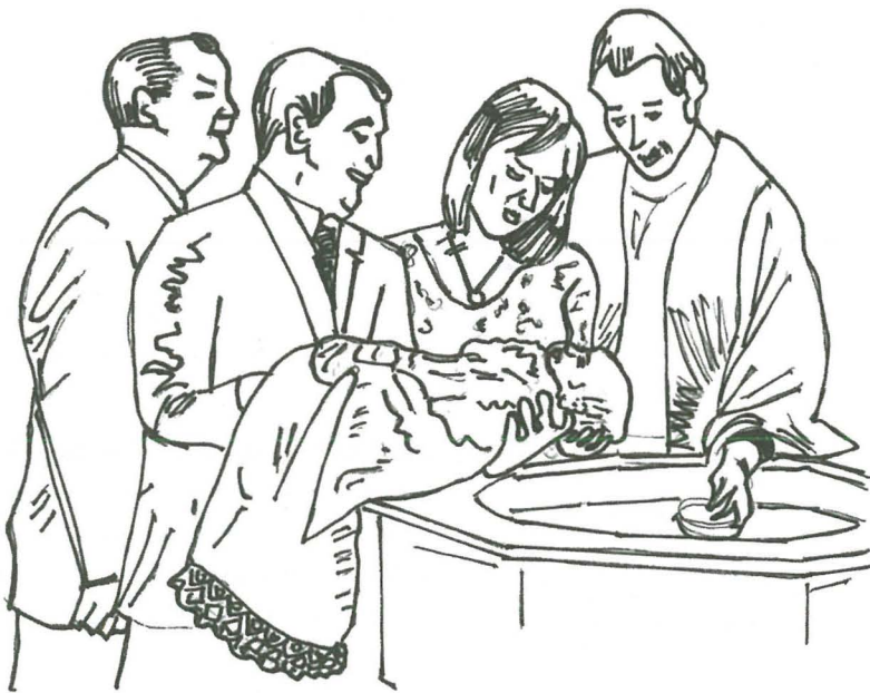
Ir-ras tinzamm mill-parrinu raġel jekk it-tarbija tkun tifel, u mill-parrina mara jekk it-tarbija tkun tifla