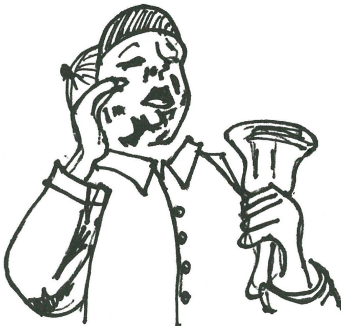
“Tal-abjad, tal-aħmar, tal-ikħal, tal-iswed u l-aħdar — għada fis-sebgha l-kumpanjament!”

Dan kien ifisser li l-fratelli tar-Rużarju, tas-Sagrament, tal-Kunċizzjoni, taċ-Ċintura u tad-Duttrina riedu jmorru għall-funeral fil-ħin. Ma' dawn kienu jiżdiedu l-qassisin li kienet tordna l-familja tat-tajjeb, u kien ikun hemm funeral daqs ta' kappillan, ukoll jekk il-mejjet kien xi bajjad jew skarpan. Id-differenza kienet tkun biss li l-kappillan kien jinġarr mikxuf fuq il-mejjilla u l-iskarpan f'tebut magħluq. Imbagħad kien ikollna l-funeral tal-foqra, meta xi ħabib kien joħroġ (jigbor) mat-triq biex isirlu tebut irħis, u l-imsejken jittieħed fil-knisja u jindifen fil-qabar tal-komun, dejjem bl-akkumpanjament tal-kappillan tal-parroċċa. F'xi parroċċi fejn hemm il-fratellanza tal-Karità, bħall-Belt, il-Birgu, u r-Rabat, il-foqra kienu jinġabru u jindifnu minn dawn il-fratellanzi tal-ħniena, li jaħsbu wkoll għall-mistrieħ tal-erwieħ kollha, għonja u foqra xorta waħda.