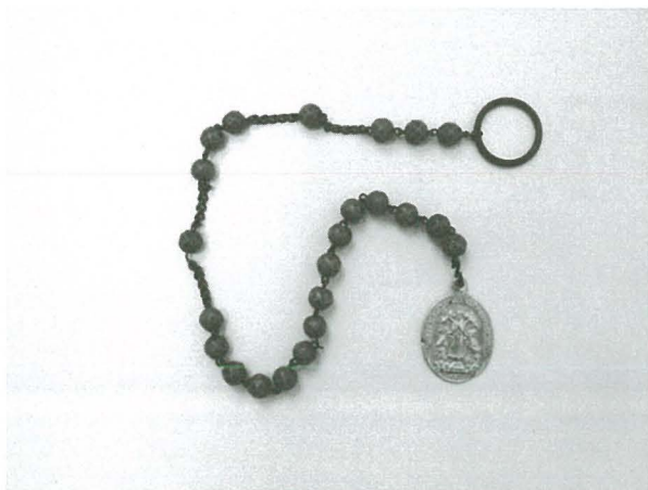
Kuruna ta' Santa Marija

Kuruna ta' San Mikiel: “Missieri kellu kuruna ta' San Mikiel imsensla fi spaga... tliet żibġiet għal disa' darbiet. Meta jinkitbu fil-fratellanza ta' San Mikiel... [It-talba] kien jgħidha kuljum filgħaxija.” ( Mara. 383 1994-03-09 (1) )