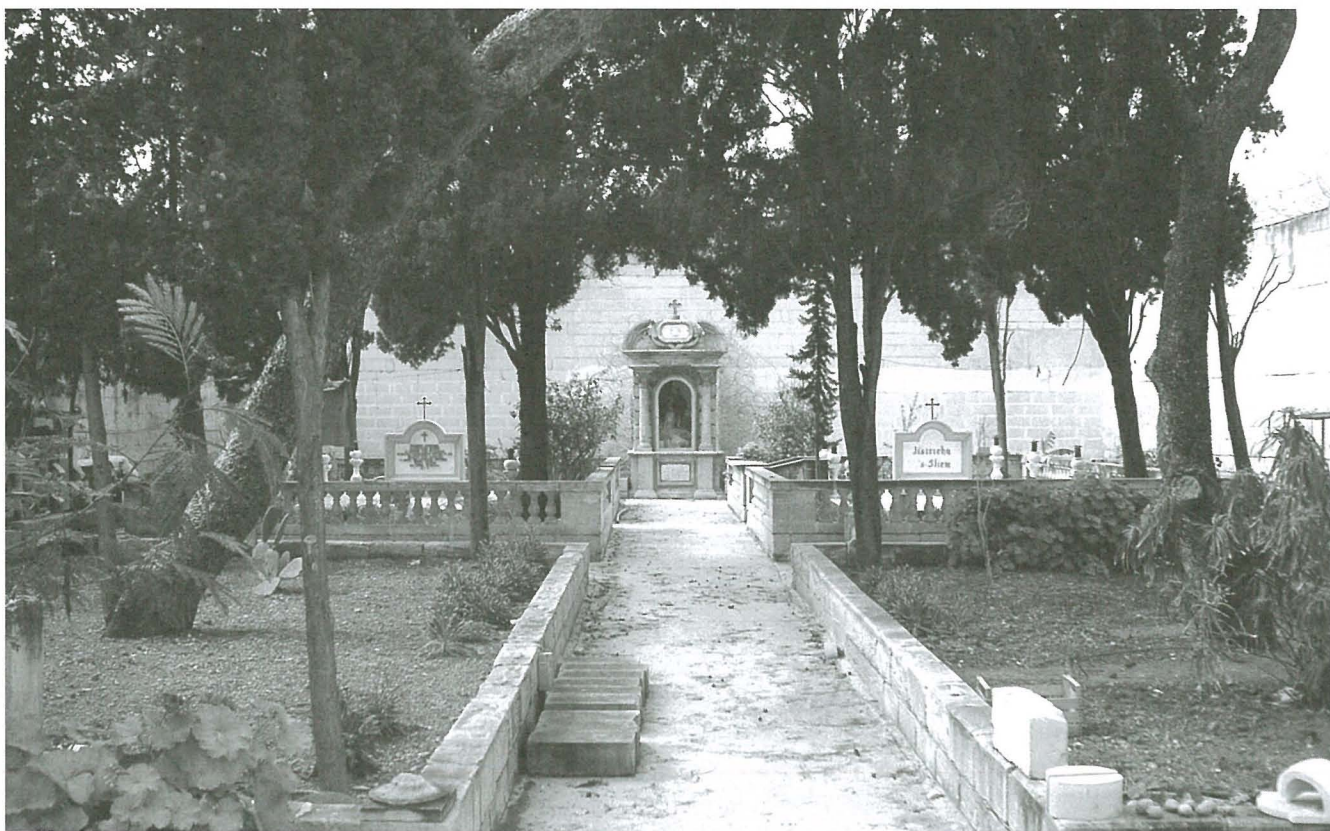
Iċ-ċimiterju tal-ħabs ta' Kordin