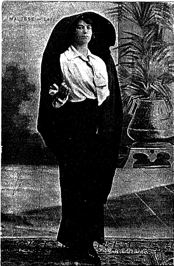
MALTESE — Lady